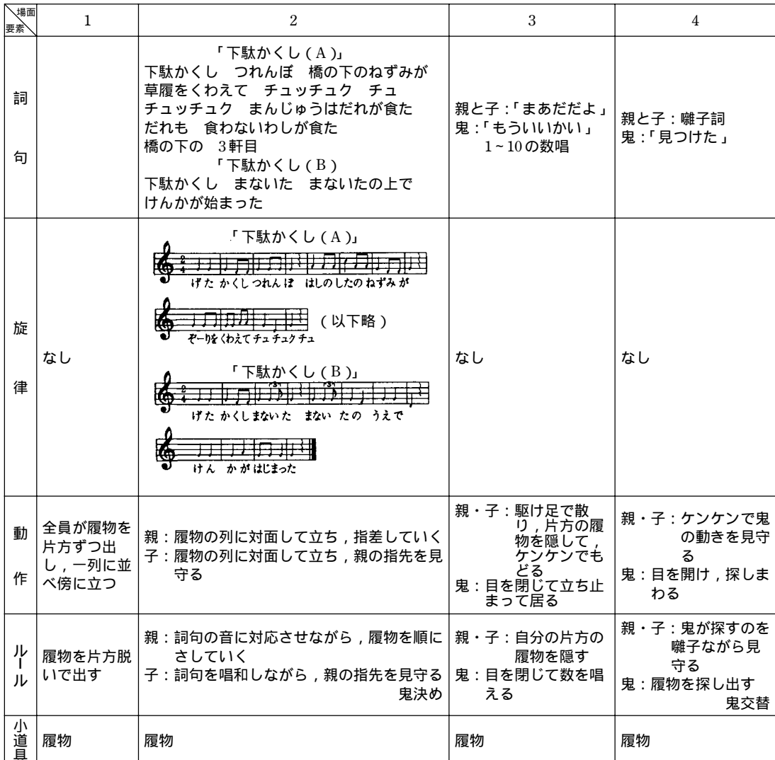
図4 「草履(下駄)かくし」の構造図

これまで検討してきた巨視的な「草履隠し」考を踏まえ、ここでは遊びを真正面から見据えて、その本質ないし特質に迫ってみたいと思う。考究に先立ち、実際には総合的な活動として展開されるこの遊びを、構造的に把えて図示を試みた。詞句、旋律、動作、ルールの4要素を抽出して縦軸にとり、遊びの流れを4場面構成と把えて横軸にとり、それぞれの内容を文字と音符で表現したものである。こうして作成された「草履隠し」(図4)の一つの手掛かりとしながら、考察を進めてゆきたい。なおここで扱った事例は小泉氏の調査を基にしたものである。