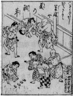
図1 ざうりかくし (『絵本西川東童』より)

ところでどうしたことが、それから一時、江戸の児戯を扱った文献からこの遊びは姿を隠してしまう。先程の書より30年余り後に出され、その頃の児戯を網羅したといわれる『童謡集』(1820)にも見当たらないのである。一方、草履を用いた鬼定めの方は、江戸の子どもたちの間で順次継承されており、その過程で遊び方にも幾分かの変化がみられる。例えば、『童謡集』の場合は、