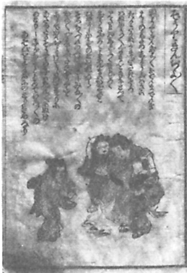
図2 ざうりきんぢょきんぢょ (『幼稚遊昔雛形』より)

ところでどうしたことが、それから一時、江戸の児戯を扱った文献からこの遊びは姿を隠してしまう。先程の書より30年余り後に出され、その頃の児戯を網羅したといわれる『童謡集』(1820)にも見当たらないのである。一方、草履を用いた鬼定めの方は、江戸の子どもたちの間で順次継承されており、その過程で遊び方にも幾分かの変化がみられる。例えば、『童謡集』の場合は、